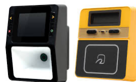
電子マネー対応 (オプション)