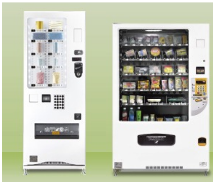
物販用自販機 冷蔵タイプ、常温タイプ