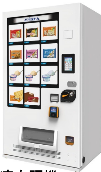
冷凍自販機 「ど冷えもん」

自販機種選定、設置場所、自販機設置への営業活動、運営方法 など弊社が持っているノウハウをご提供致します。